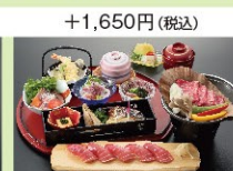
本マグロ握り寿司和風御膳