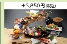
7段懐石「華壇(かだん)」

新型コロナウイルス感染症予防対策を徹底しております。詳しくはスパ久慈HPにて公開中!