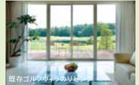
既存ゴルフヴィラのリビング